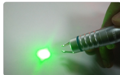
532 нм зелёный лазер

Хирургия Терапия Ветеринария Косметология (3В/5В/8В - 532 нм зелёный лазер)