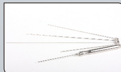
Наконечник для липолиза