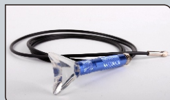
Наконечник для отбеливания