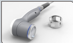
Наконечник для терапии